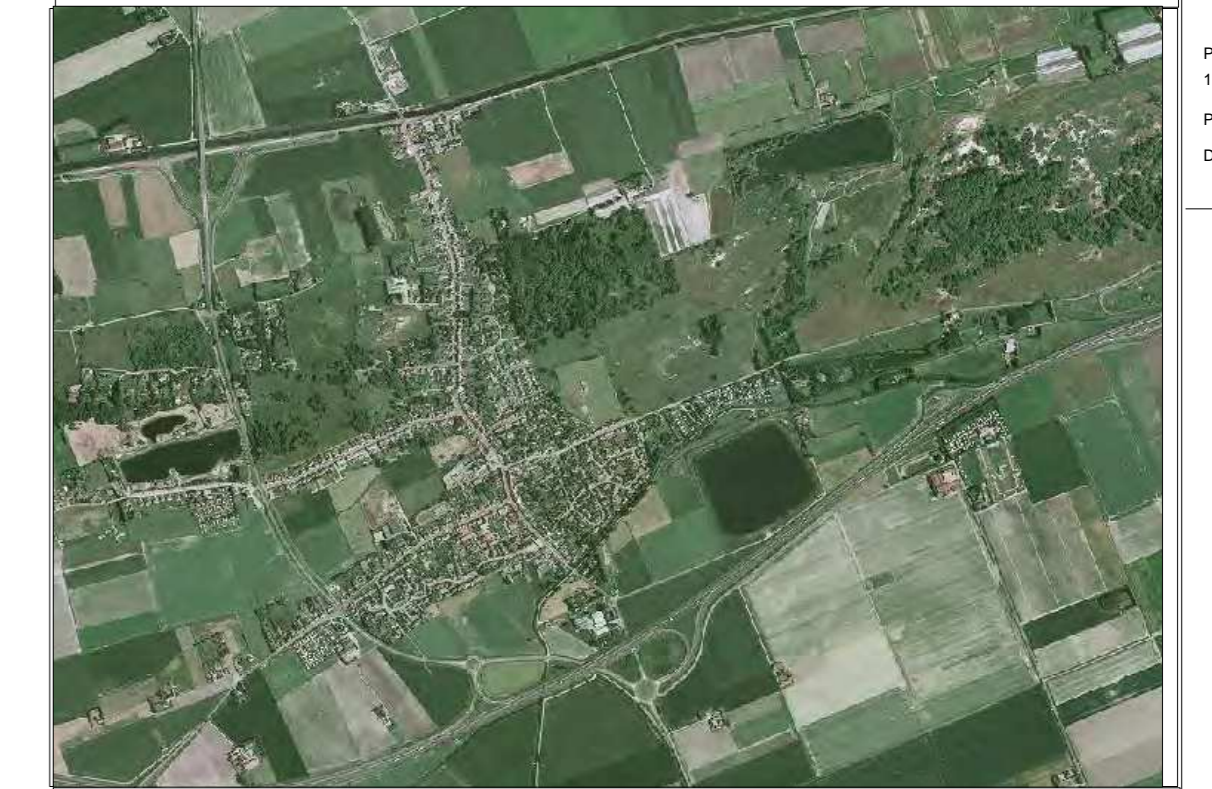
PLANCHE DESSINEE LE : 02/06/2010 PLANCHE MISE A JOUR LE : 11/06/2010 PROJETS : Révision Département du : 59260