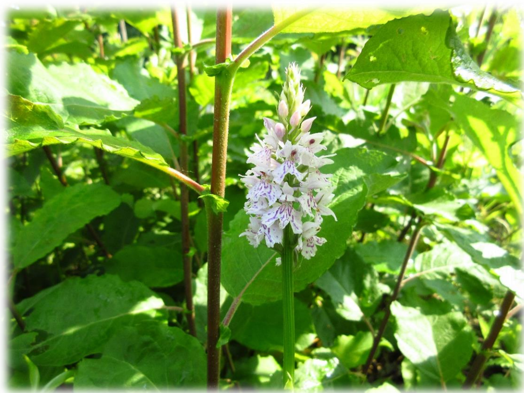
USAN, orchidée, Phalempin