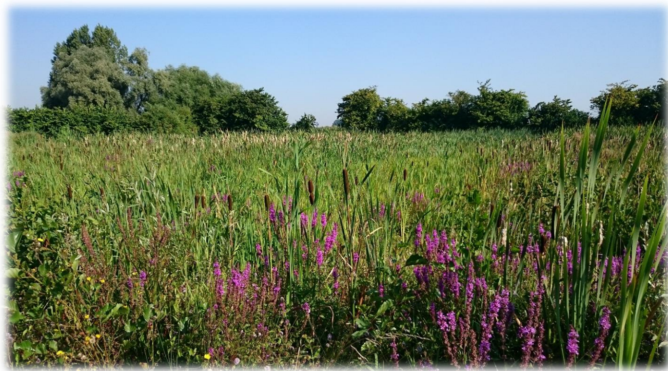
USAN, bassin de rétention, Quesnoy-sur-Deûle