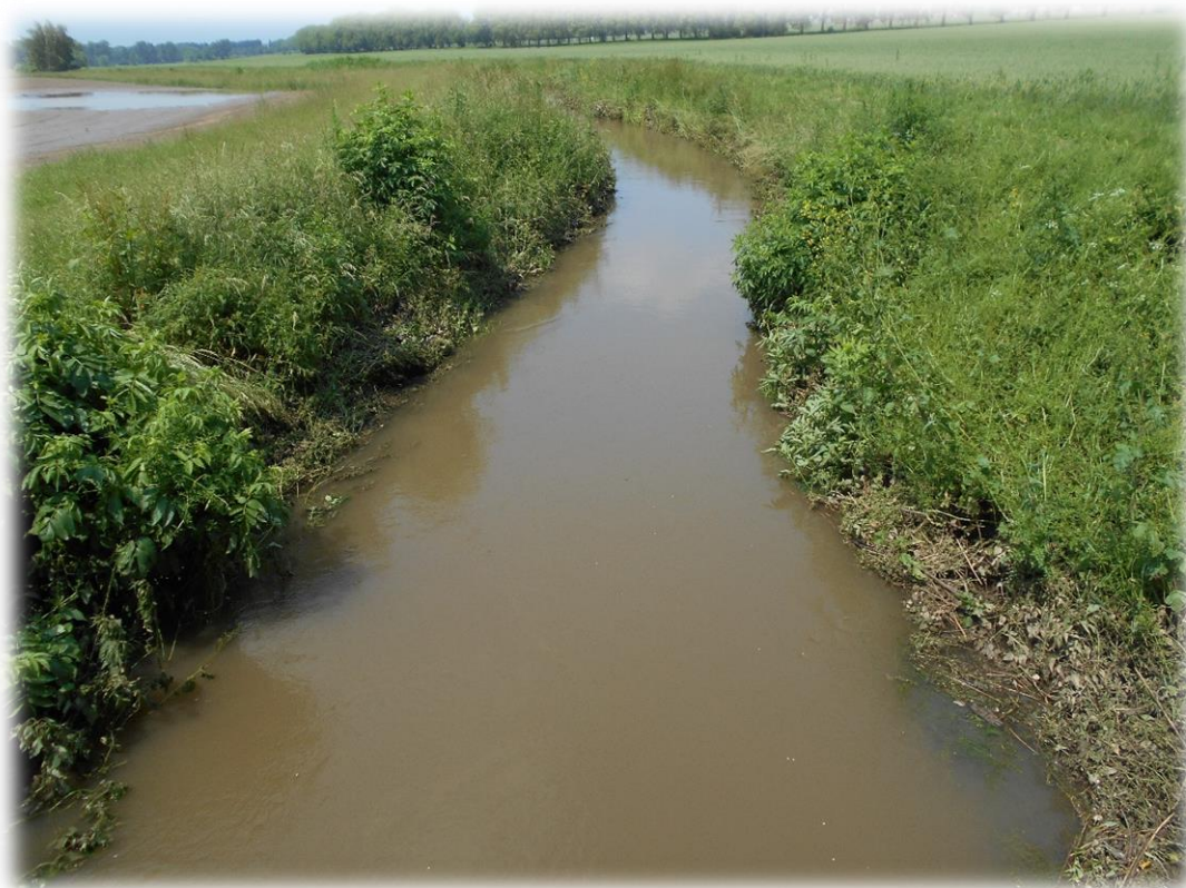
USAN, Naviette de Seclin