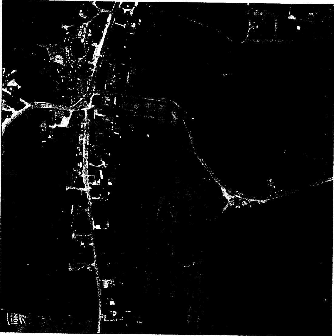
Terrain de la future station d'épuration